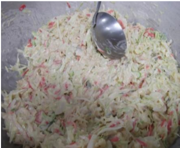
①生地を作ります。すりおろした生の山芋も入れました。