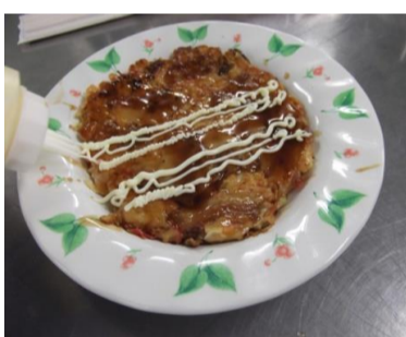
③市販のお好み焼き用ソースではなく、オリジナル調合の自家製ソースをはけでぬり、格子柄にマヨネーズをシュッとぬり.....