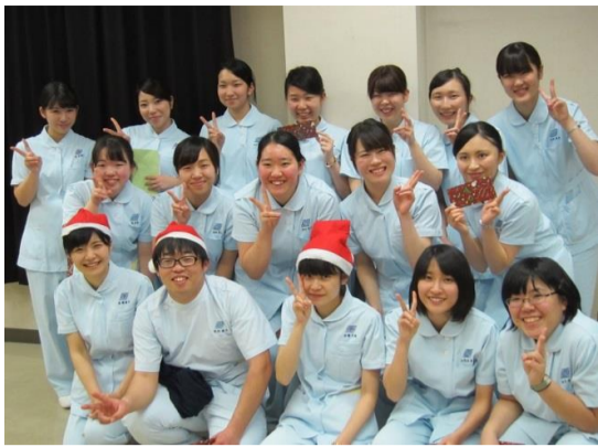
※写真は、昨年の様子です。