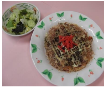
⑥出来上がりです。こつてりに見えますが、キャベツ100gとたっぷり野菜の1品です。