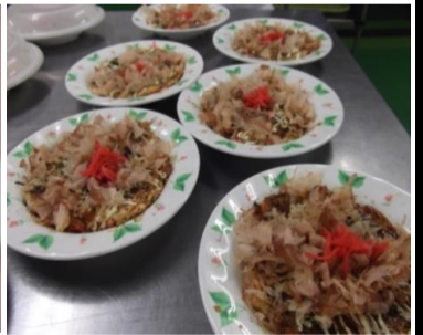
⑤最後に鮮やかな紅ショウガを飾りつけ...