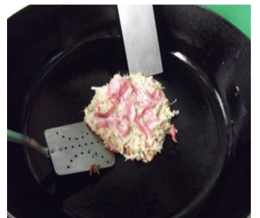
②豚バラ肉のコッテリ感とかつおの濃厚だしでうま味を出します。