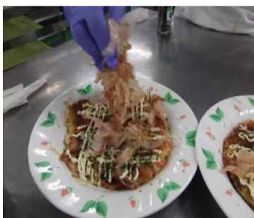
④青のり粉に荒削りのかつおぶしをたっぷりのせて...