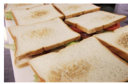
⑥残りのパンでサンド！