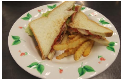
フライドポテトも添えて 喫茶店風をイメージしました♪

べよ、ド、 次、り、ベ、 回、コ、イ、 も、ン、ツ、 乞、の、マ、 う、厚、チ、 ご、え、は、 期、さ、は、 待、を、厚、 ！、増、切、 討、し、り、 中、う、す、 で、で、す、 す、と、！、 。、ね、。、ン、