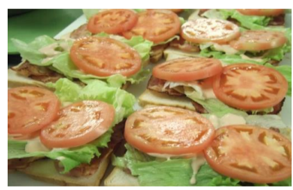
⑤トマトを乗せて... 赤色が入ると鮮やかでキレイです！