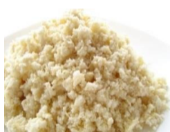
⑤:おからを使用しています！小麦粉をおからに変える事でカロリーダウンに成功！