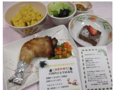
今年も香ばしい香りと焼き色が美味しく出来上がりました！