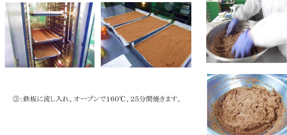
①:材料を全部混ぜ合わせます。

クリスマスディナーのメイキング集。材料を全部混ぜ合わせ、土のようですが、良い香りの生地です。焼きあがったら冷蔵庫で冷やし、熱がとれたらメイクアップ！