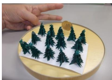
500円玉位の大きさを180体完成まで3ヶ月かかりました。