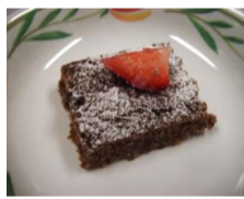
④:焼きあがったら冷蔵庫で冷やし、熱がとれたらメイクアップ！粉糖とイチゴを合わせて完成です！