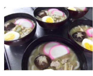
⑤: 程良く麺にスープがしみ込んだら盛付け開始！