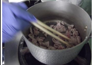
②: 豚肉は先に炒めておく事でアクが出にくくなります。