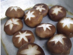
①: 具材はお好みの大きさにカット。しいたけは花模様を付けると見た目がぐっと美味しそうになります！