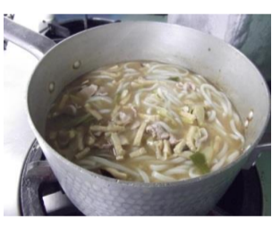
④: 味付けが決まったら麺投入！弱火で15分ほどコトコト煮込みます。