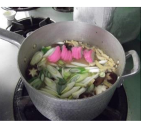
③: 炒まったら水を入れ、具材を全部投入し味付けを行います。(しいたけも出汁が出るので一緒に煮て後ほど取り出します)