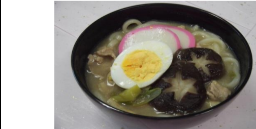
完成です。赤や黄色が入ると更に美味しく見えますね。ねぎは青い部分を別茹でし、最後に添えると更に彩りの整った見栄えになりそうですね！(反省点です...) ご家庭でも簡単に作れちゃうメニューです。寒い日の続く今だからこそ美味しく食べられると思います。ぜひ作ってみてください♪